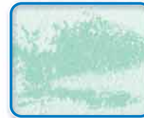
Peinture aqueuse standard

Application, sur une plaque de béton pré-peinte en vert, d'une couche de peinture blanche. Séchage 30 minutes à température ambiante puis arrosage pendant 15 minutes.