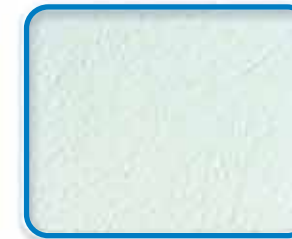
Peinture Pliolite solvantée